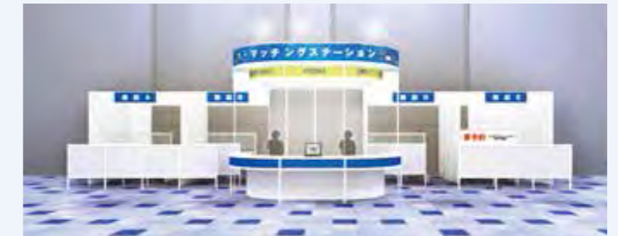
マッチングステーションイメージ